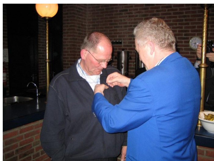
Uitreiking van de Gouden Scheidsrechter op 17 maart 2008 in Café Restaurant “De Vrolijkheid” te Zwolle.